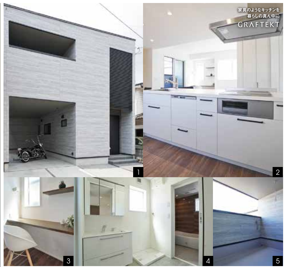
1. ビルドインガレージがアクセントになるスタイリッシュな外観。ガレージはセンサー付き照明で夜も安心に入ることができます。2. 家具のような佇まいが空間を彩るグラフィテクトのキッチンを採用。階段を上がってすぐに収納があり買物の動線も最短に。3. ちょっとした勉強スペースや洗濯物をたたむスペースとして、様々な使い方ができるカウンター。4. 動線が考えられた水回り。バルコニーへ洗濯物をそのまま干しに行けるので家事も楽々。5. ルーフバルコニーは洗濯物を干すだけでなく、ガーデニングやバーベキューなどおうち時間を楽しく過ごせる空間にも。

CREST HOUSE 販売代理店 (株)クレスト不動産販売 TEL.084-925-1122 〒720-0801 広島県福山市入船町1丁目4-15 【営業時間】9:00~18:30(水曜定休) http://www.crest-realestate.jp/ ■建築工事業・内装仕上工事業/広島県知事許可(特28)第28770号 ■不動産業全般/広島県知事許可(特5)第8333号 ■クレスト二級建築士事務所/広島県知事登録18(2)第2520号 クレスト不動産販売